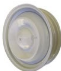
Jante gris rosée