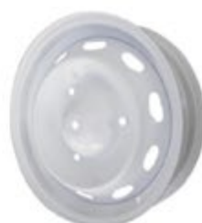
Jante Azur ajourée